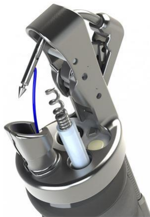
Figura 1. Endostitch, Apollo Endosurgery.