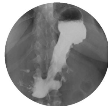
Figura 3. Estudo do trânsito gastro-duodenal 1 semana após o procedimento.

Como se pode observar na tabela 1, registou-se perda ponderal 6,8-12,4% ao primeiro mês e 14,2-19,5% aos 6 meses de pós-procedimento.