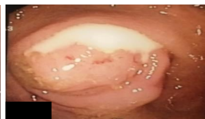
Imagens 1 e 2: Imagens de colonoscopia levantando suspeita de apendicite aguda